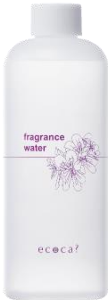
フレグランス ウォーター 参考小売価格(税込):2,861円