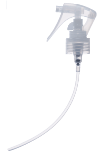
フレグランス ウォーター300mlボトル 専用トリガー式スプレー 参考小売価格(税込):195円