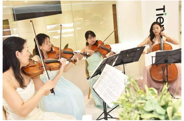
オープニングセレモニーを奏でるオーケストラ