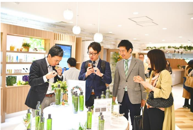
タッチアンドトライコーナーやタッチパネルで製品情報を確認