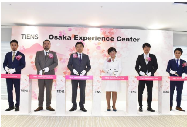
オープニングセレモニーテープカット