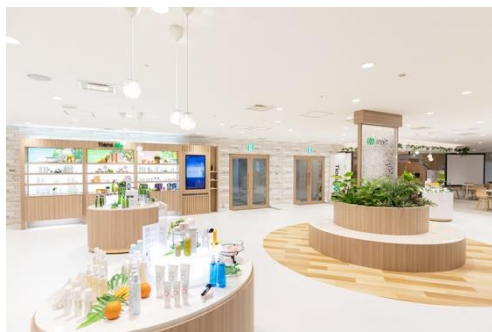
500㎡を超えるスペース

最寄駅：大阪メトロ中央線・堺筋線「堺筋本町」駅 徒歩3分 大阪メトロ御堂筋線・四つ橋線・中央線「本町」駅 徒歩5分