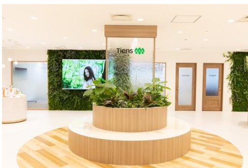
エントランス正面より