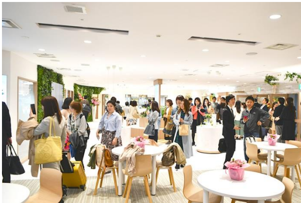
グランドオープン初日、多くの方々にご来場いただきました